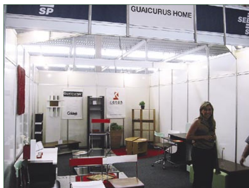
Um dos estandes presentes na Movinter 2004

O Sindimov esteve presente na Movinter 2004 – V Feira de Móveis do Estado de São Paulo, que aconteceu em Mirassol no mês de agosto, superou as expectativas. Com quase 35 mil visitantes, a feira movimentou cerca de R$170 milhões em negócios, números superiores à última edição do evento, ocorrido em 2002. Durante os cinco dias, a Movinter recebeu participantes de 600 municípios brasileiros e de 13 países.