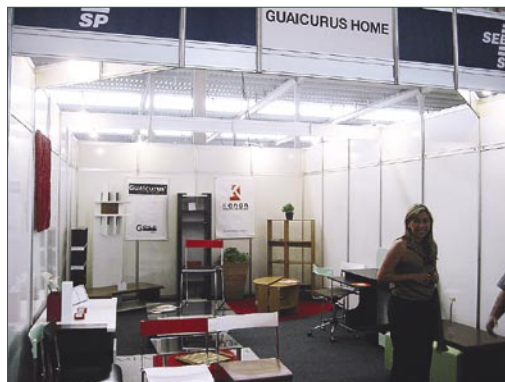
Um dos estandes presentes na Movinter 2004

O Sindimov esteve presente na Movinter 2004 – V Feira de Móveis do Estado de São Paulo, que aconteceu em Mirassol no mês de agosto, superou as expectativas. Com quase 35 mil visitantes, a feira movimentou cerca de R$170 milhões em negócios, números superiores à última edição do evento, ocorrido em 2002. Durante os cinco dias, a Movinter recebeu participantes de 600 municípios brasileiros e de 13 países.